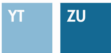
SKY BLUE AZURE BLUE