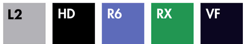
LIGHT GREY MARL DARK HEATHER GREY HEATHER ROYAL HEATHER GREEN HEATHER NAVY