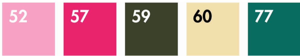
LIGHT PINK FUCHSIA CLASSIC OLIVE NATURAL EMERALD