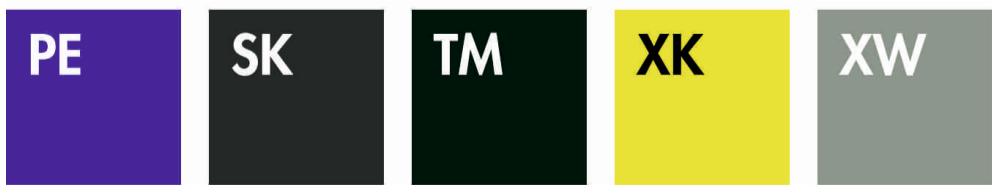
PURPLE SMOKE FOREST GREEN BRIGHT YELLOW ZINC