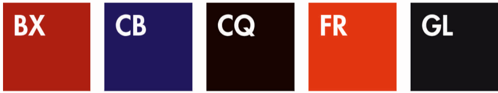
BRICK RED COBALT BLUE CHOCOLATE FLAME LIGHT GRAPHITE