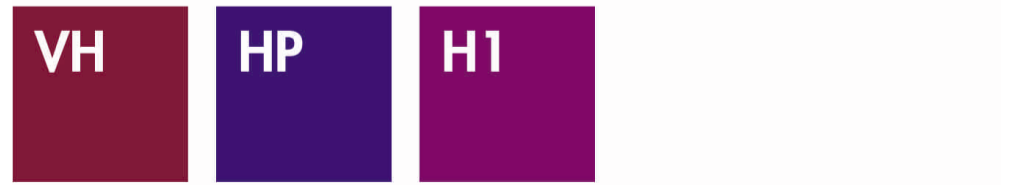
HEATHER RED HEATHER PURPLE HEATHER BURGUNDY