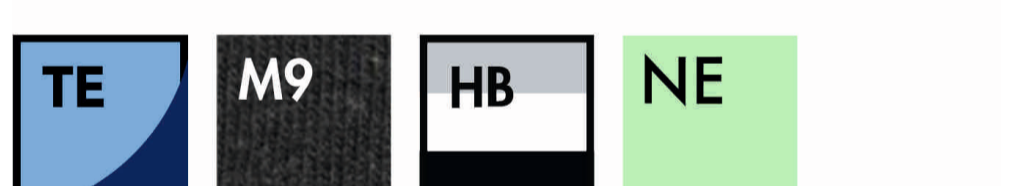
NAVY / MID BLUE MARL / NAVY BLACK / MELANGE GREY HEATHER GREY / WHITE / BLACK NEO MINT