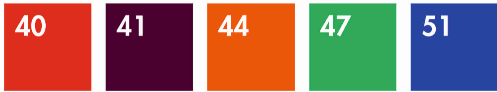
RED BURGUNDY ORANGE KELLY GREEN ROYAL BLUE