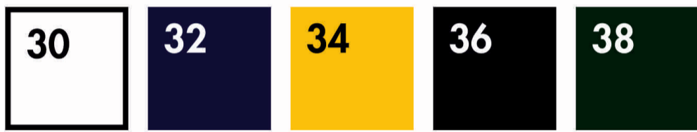
WHITE NAVY SUNFLOWER BLACK BOTTLE GREEN