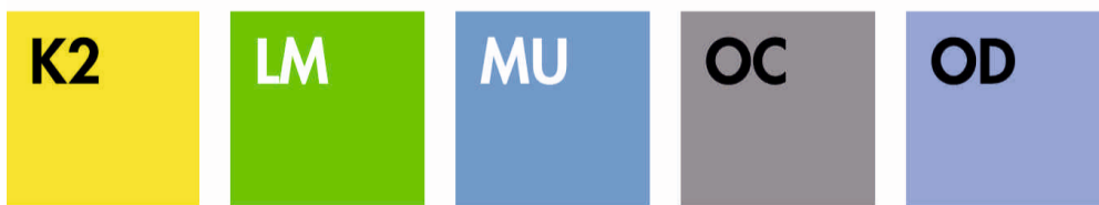
YELLOW LIME MID BLUE OXFORD GREY OXFORD BLUE